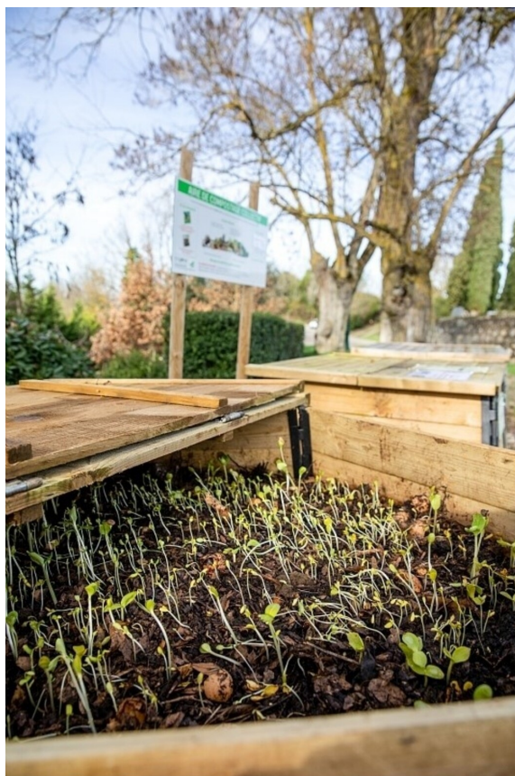
Lapeyere Sébastien - Région Occitanie