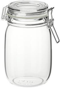
Pack Zéro Emballage