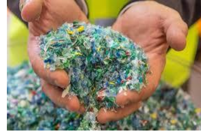
Etude filière recyclage des plastiques en Occitanie

AMI Accompagnement de démarches intégrées de réduction des déchets provenant des bassins versants